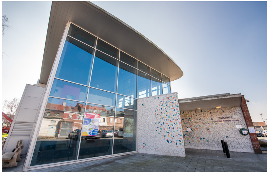
Maternité du Centre Hospitalier de DENAIN